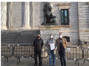
27.01.2021. Solicitud de audiencia al presidente del Gobierno