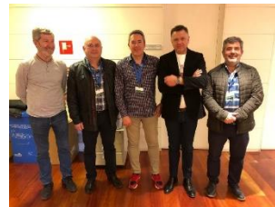
15.03.2019. Reunión con miembros de la Comisión de defensa de podemos