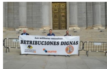
16.10.2021. Manifestación en Madrid por unas "Retribuciones dignas", organizado por ASFASPRO-AUME-ATME