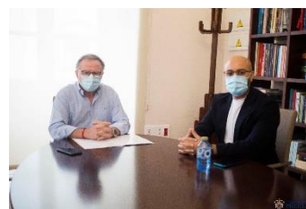
14.07.2021. Reunión de ATME con presidente Ciudad Autónoma melilla