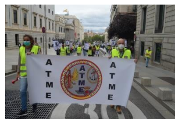
19.07.2020. Manifestación en Madrid "Menos palabras y más hechos. Retribuciones dignas"