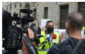
19.07.2020. Rueda de prensa posterior a la manifestación en Madrid "Menos palabras y más hechos. Retribuciones dignas"