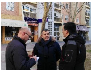
24.01.2018. Entrevista a El Periódico de Aragón