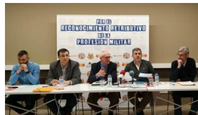
04.02.2019. Por el reconocimiento retributivo de la Profesión Militar. ASFASPRO-AUME-ATME-AMTM-UMT