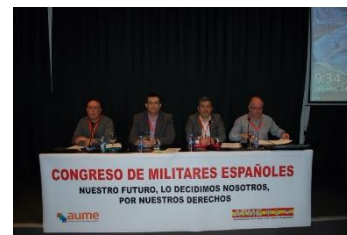
24.02.2018. I Congreso de Militares Españoles, organizado por AUME-ATME