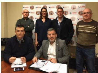
20.12.2017. Rueda de prensa AUME-ATME contra la situación de desamparo y de frustración generalizada en la que se encuentran los miembros de las Fuerzas Armadas

ATME ha sido capaz de encontrar cauces de dialogo y entendimiento con la mayoría de las asociaciones que forman o han formado el Consejo de Personal de las Fuerzas Armadas (COPERFAS) y, es su voluntad, continuar intentándolo en el futuro.