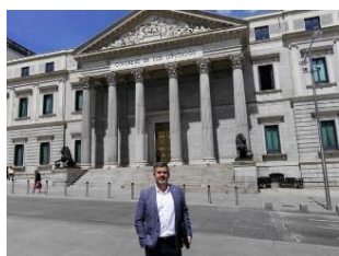
26.04.2017. ATME ante la Subcomisión de Defensa para el estudio del régimen profesional de los militares de tropa y marinería

Para conseguir lograr los objetivos marcados, ATME realiza su labor en múltiples frentes, sin excluir ninguno, ante la certeza de que las soluciones no pasan por limitarse a un solo objetivo, ni buscarlos en una sola dirección.