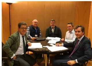
22.01.2019. Reunión con miembros de la Comisión de defensa de podemos