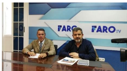
20.04.2017. Entrevista en El Faro tv

Aparte de todo lo anterior, muchos de ellos, deberán abandonar a una edad tan crítica como los 45 años las Fuerzas Armadas, con una asignación no contributiva, que en ningún caso es una jubilación o prejubilación.