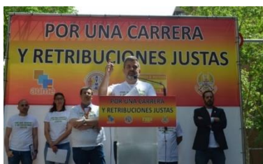
12.05.2018. Concentración por "Una carrera y retribuciones justas"