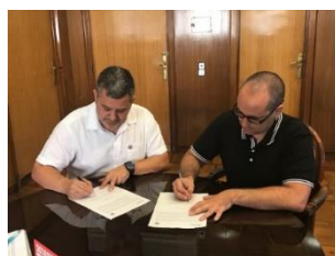
24.07.2018. Firma convenio de ATME con el Ayuntamiento de Zaragoza para reserva de plazas en la Policía Local