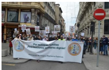
16.10.2021. Manifestación en Madrid por unas "Retribuciones dignas"