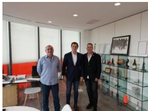
30.10.2019. Reunión con el presidente de Ciudadanos