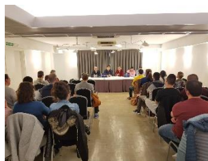
17.01.2018 A 14.02.2018. Charlas conjuntas AUME-ATME en preparación I Congreso de Militares Españoles (Segovia, Pamplona, Zaragoza, Valladolid, Salamanca, Sevilla, Murcia y Valencia)