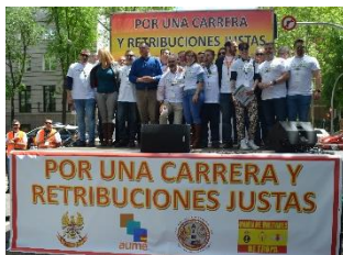
12.05.2018. Concentración por "Una carrera y retribuciones justas", organizado por AUME-ATME-AMTM-UMT