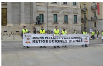
19.09.2020 19.07.2020. Manifestación en Madrid "Menos palabras y más hechos. Retribuciones dignas", organizado por ATME-UMT